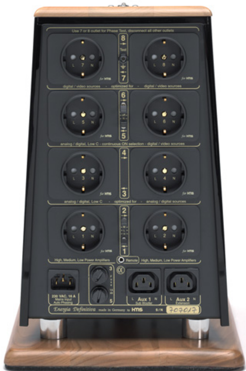
Power-Station: Die zweite Steckdosen-Reihe von oben ist wahlweise immer am Netz, die beiden linken mittleren Dosen hängen an 160-Watt-Trenntrafos

Das Resultat aller Beobachtungen und Überlegungen steht für Strassner außer Frage: Nur komponentenspezifisch getrennte Filter stellen letztlich, im Teamwork mit entsprechenden Netzkabeln und Kontakten mit möglichst niedrigen Übergangswiderständen, die richtige Lösung dar. Energia Definitiva verfügt aus diesem Grund gleich über einen ganzen Satz spezieller Netzfilter, die getrennt für die einzelnen Dosen zuständig sind; zwei der Schukodosen wurden zudem mithilfe von Trenntrafos galvanisch