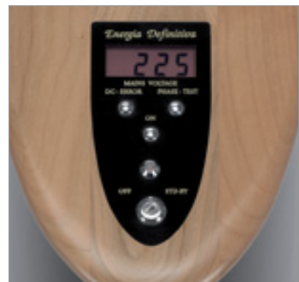
Schlüsselschalter (unten), Hauptschalter und umschaltbares Display