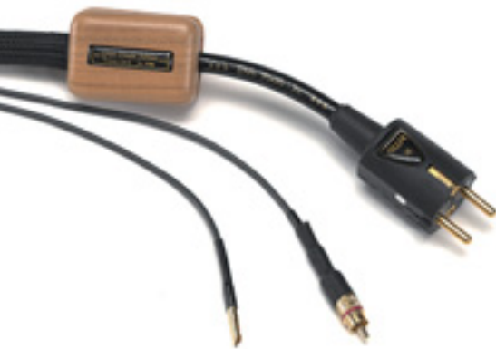
Das Messkabel zum Ausphasen (vorne) und von HMS empfohlene Netzkabel

schalten. Wer hier bereits angesichts bekannt unzulänglicher Schalter sofort die Stirn runzelt, liegt schief: Ein ganzer Satz spezieller parallel liegender Relais verwaltet die Stromzufuhr, übrigens natürlich Einschaltstromgebremst und Überspannungsgesichert, zum Schluss brückt ein Goldkontakt-Relais nochmals die Kontakte, so dass etwaige Übergangswiderstände praktisch ausgeschlossen sind. Alle Dosen verfügen über feinste, erst weichverkupferte und dann vergoldete Kontakte. Zwei der Dosen sind jeweils auf Schalt- oder Dauerbetrieb einstellbar; Geräte, die permanent am