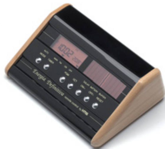
Die mit Funkuhr ausgestattete Fernbedienung weiß auch die Temperatur