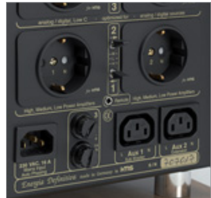
Die beiden unteren Steckdosen besitzen umschaltbare Netzfilter